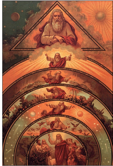
Sedm dní stvoření, 19. stol.

Zeptejte se, řekněme, na archanděla Gabriela – kolik lidí, tolik názorů. Skutečný angelolog nezačíná autosugescí, ale nesobeckou službou světu, obětí. Ta ho zviditelní v očích duchovních bytostí a připraví na přijetí pravé inspirace. A svou vnitřní vizi si prověřuje na zkušebním kameni praktické reality, aby ji očistil od sebeklamů. Pravé duchovní poznání nám musí poskytnout účinnou schopnost porozumět přírodě, dějinám a člověku, neboť se jím spojujeme s tvůrčími inteligencemi, jež podmiňují evoluci, světové dění a lidské osudy. Přítomnost těchto bytostí však nelze koupit, vyprosit ani vynutit. Zjeví se tomu, komu chtějí a kdo si to zaslouží.